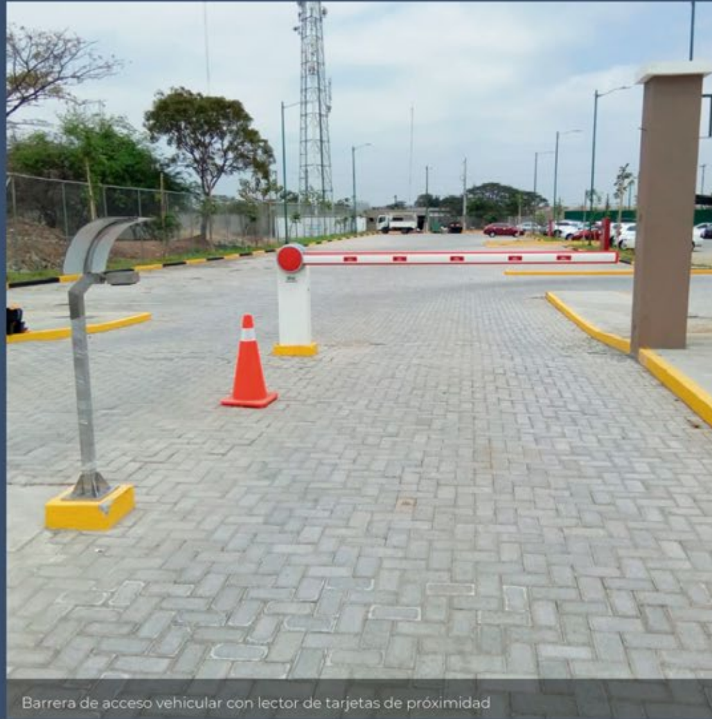
Barrera de acceso vehicular con lector de tarjetas de proximidad