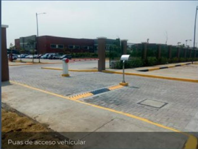
Puas de acceso vehicular