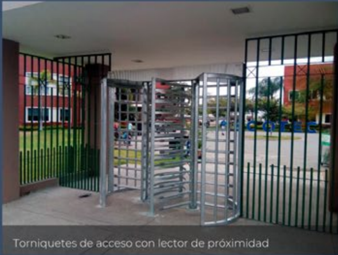
Torniquetes de acceso con lector de proximidad